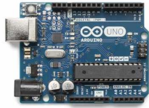
Carte Arduino Uno Rev 3