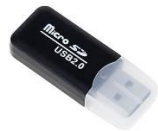
Lecteur USB de carte micro SD