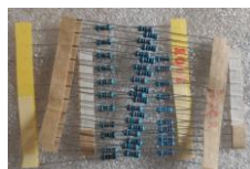
Leds, boutons et résistances