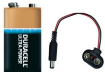
Pile 9V + câble d'alimentation