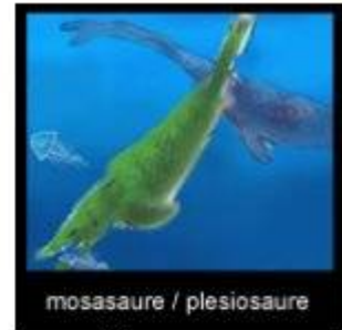
mosasaure / plesiosaure