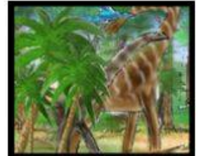
barosaure / brachiosaure